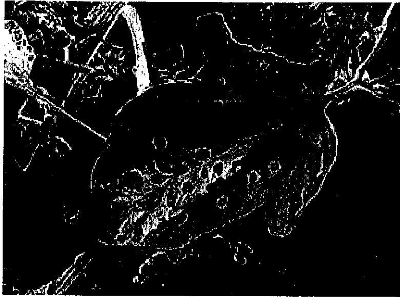
Atac pe frunze