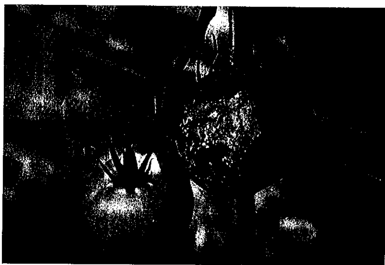
Atac pe fructe