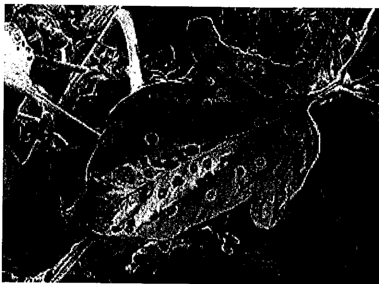
Atac pe frunze